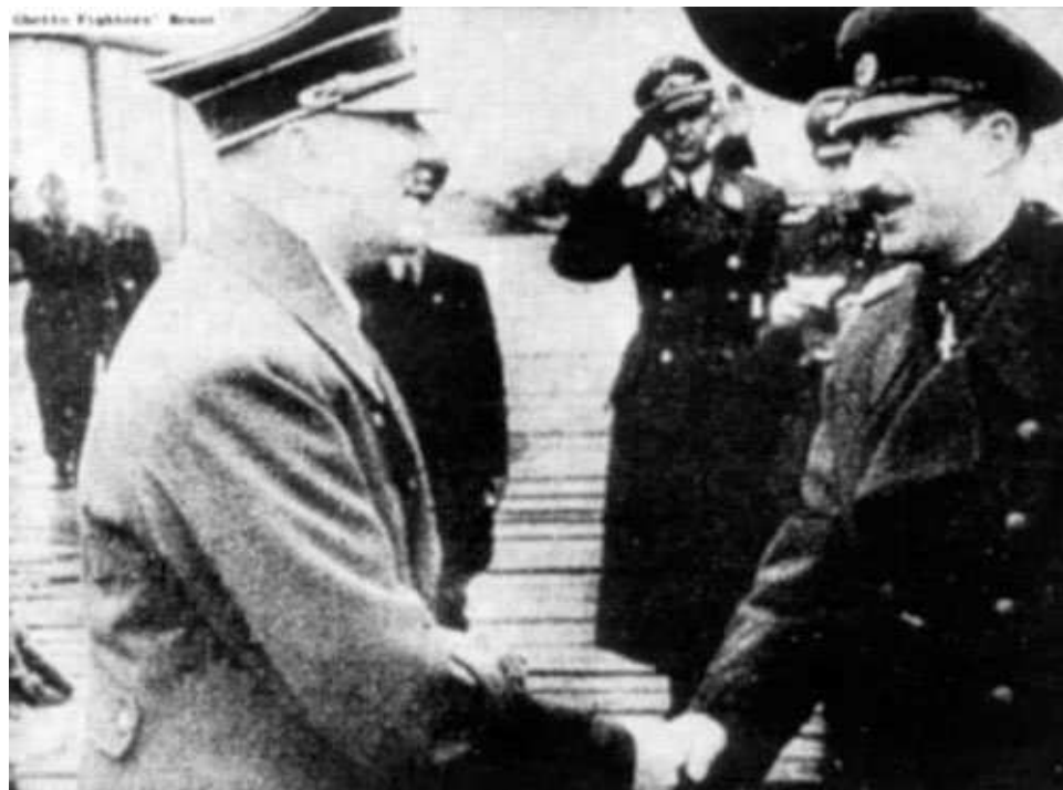
Ο Βούλγαρος Βασιλιάς Βορίς Γ' και ο Αδόλφος Χίτλερ