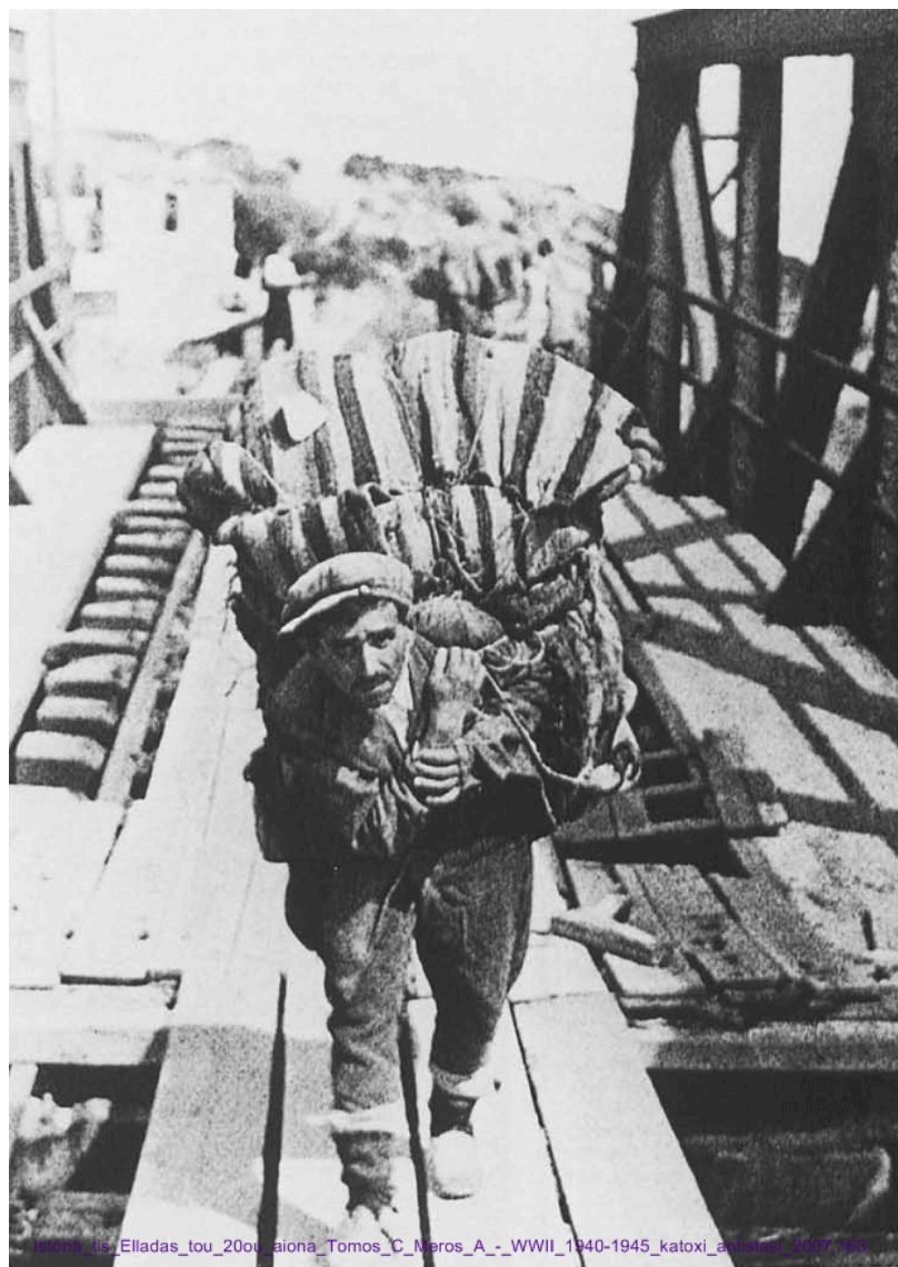
Ελλάδα, 1945. Ένας πρόσφυγας που μεταφέρει τα υπάρχοντά του σε μια γέφυρα.