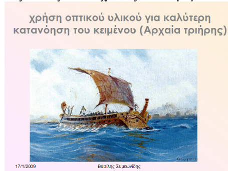
Σχήμα 1: αρχαία τριήρης πλέοντας με χρήση και του μεγάλου ιστίου

Ακολουθούν δύο διαφάνειες με εισηγμένες εικόνες. Πρώτα ένας χάρτης του Ελλησπόντου που είναι ο γεωγραφικός χώρος αναφοράς του κειμένου. Οι μαθητές είναι ήδη εξοικειωμένοι με τα τοπωνύμια από τη διδασκαλία των προηγούμενων αποσπασμάτων, καθώς το μάθημα των Αρχαίων Ελληνικών στην Α' Λυκείου βασίζεται σε εκτενή αποσπάσματα από τα Ελληνικά του Ξενοφώντα. Επίσης, είναι ήδη εξοικειωμένοι με την περιοχή του Ελλησπόντου από το εποπτικό υλικό του σχολικού βιβλίου. Αυτό τους βοηθά να προσεγγίσουν το κείμενο από τα σημεία που μπορούν να συσχετίσουν με τη διδασκαλία των προηγούμενου κειμένου. Στη συνέχεια προβάλλεται η εικόνα τριήρους να ταξιδεύει έχοντας και το μεγάλο πανί της (σχήμα 1).